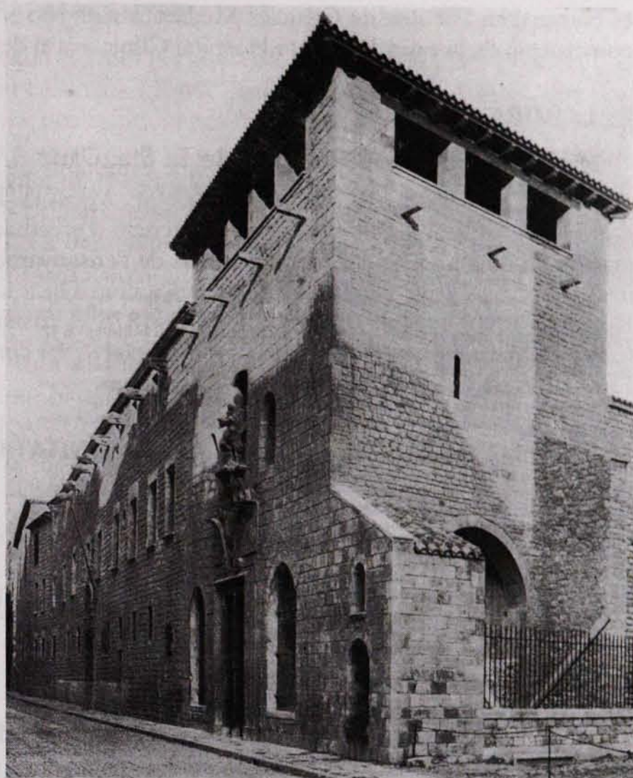
FIG. 61. Antic Hospital de la Santa Creu.