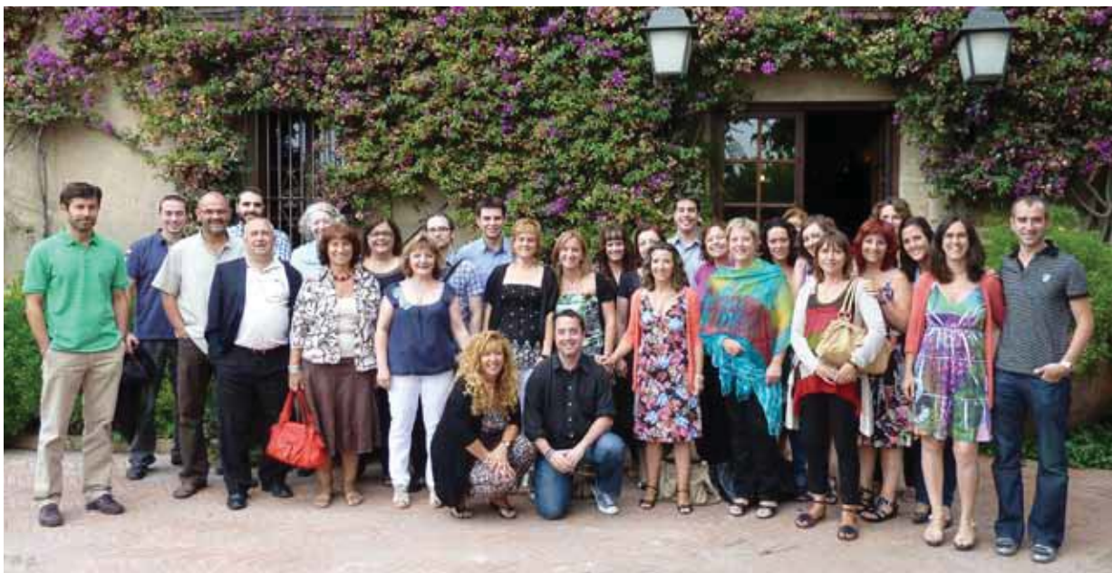
Personal de l'Acadèmia en el dinar de fi de curs. Juliol 2011