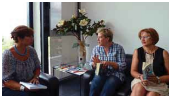
Sessió del Club de Lectura