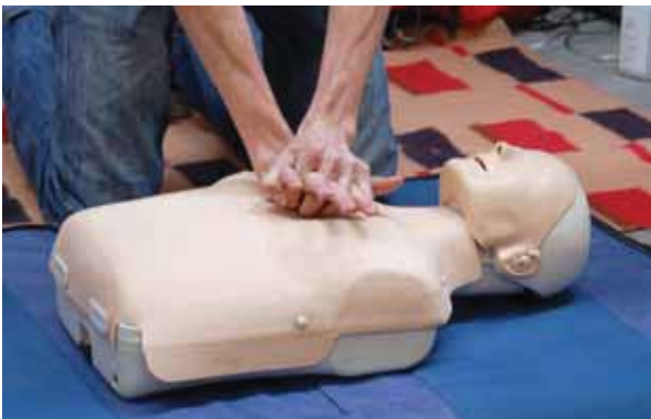
Sessió de pràctiques de Reanimació Cardiopulmonar

En data 20 d'abril de 2010, es va fer una revisió completa tant de les condicions de seguretat en el lloc de treball com del pla de vigilància de la salut. Aquest estudi l'ha portat a terme MC Prevenció i el resultat ha estat plenament positiu ja que no s'han detectat riscos significatius per a la salut en general.