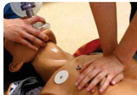
Pràctiques de Reanimació Cardiopulmonar (RCP)

La Fundació Acadèmia té la voluntat de continuar aprofundint en aquest objectiu de benefici social de tot el personal que hi treballa. Aquesta és, sens dubte, la millor inversió per al futur de la institució.