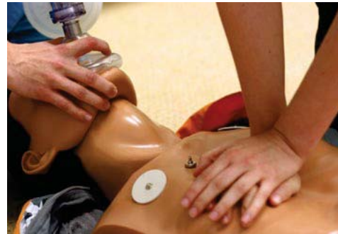
Pràctiques de Reanimació Cardiopulmonar (RCP)

La major part del personal de l'Acadèmia realitza un curs de Reanimació Cardiopulmonar bàsic i, dins del comitè d'emergències, hi ha un grup que realitza el curs avançat DEA i que està preparat per utilitzar l'equip de reanimació que tenim situat a l'entrada de l'Acadèmia. L'últim curs de reciclatge es va fer el 17 d'octubre de 2014.