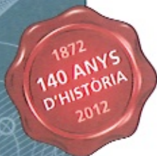
Àlvar Net Castel